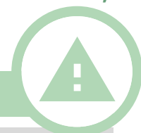
Tableau 2 : Situations nécessitant des précautions particulières pour la pratique de l'AP, d'après le rapport de l'Inserm (Tableau issu des recommandations de la HAS)